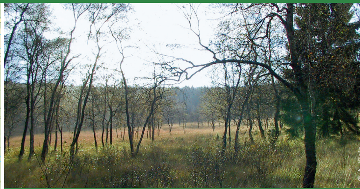
Blick ins Moor