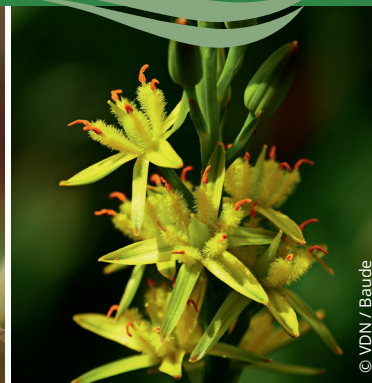
Blütenstand der Moorlilien