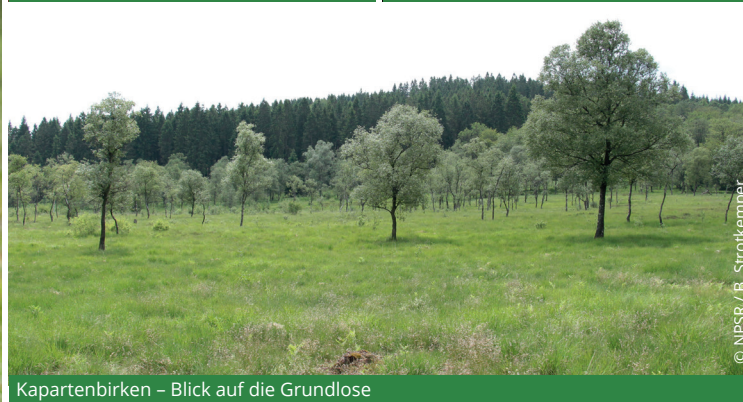
Kapartenbirken – Blick auf die Grundlose